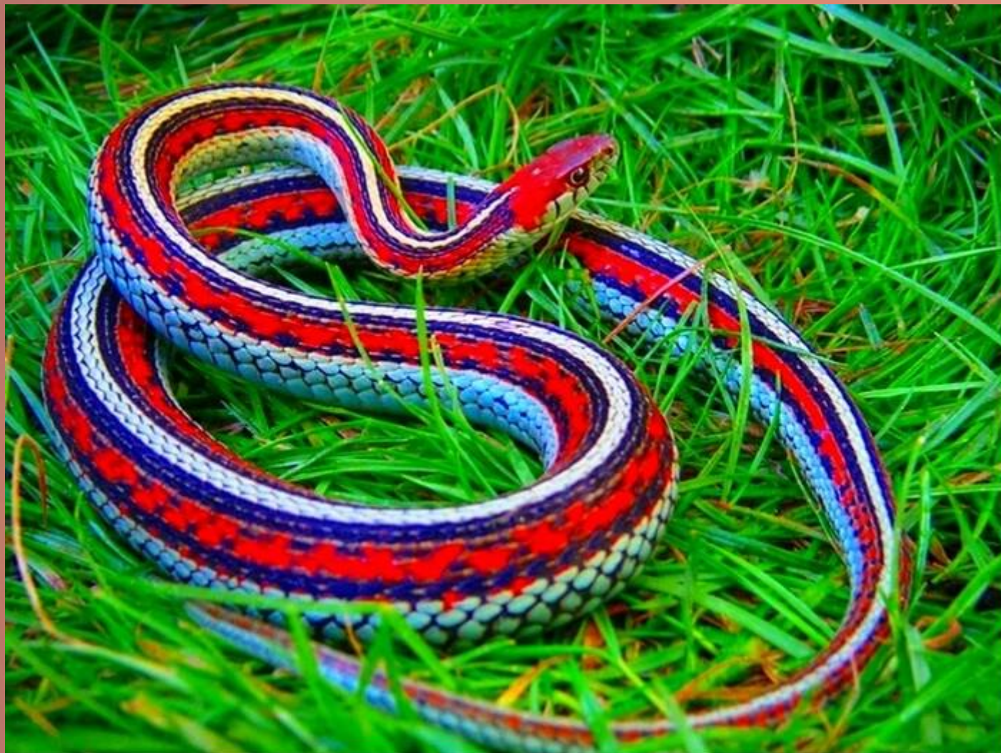
КАЛИФОРНИЙСКИЙ ПОДВЯЗОЧНЫЙ УЖ