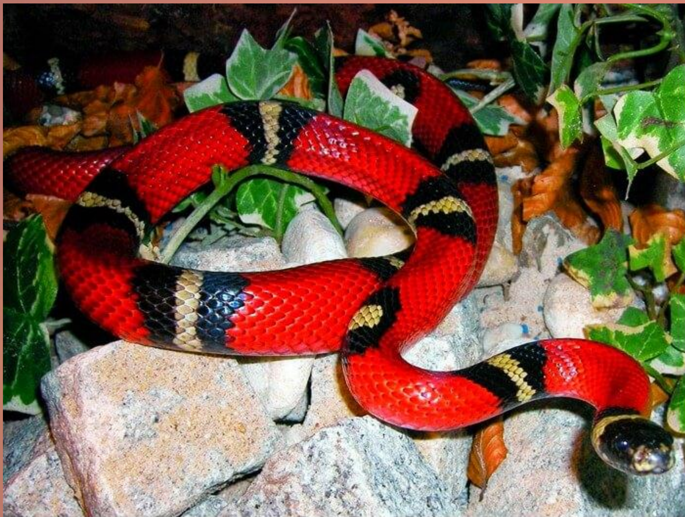
Поперечнополосатая королевская змея