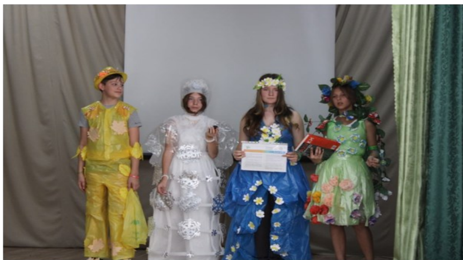
Члены команды «НЭО»