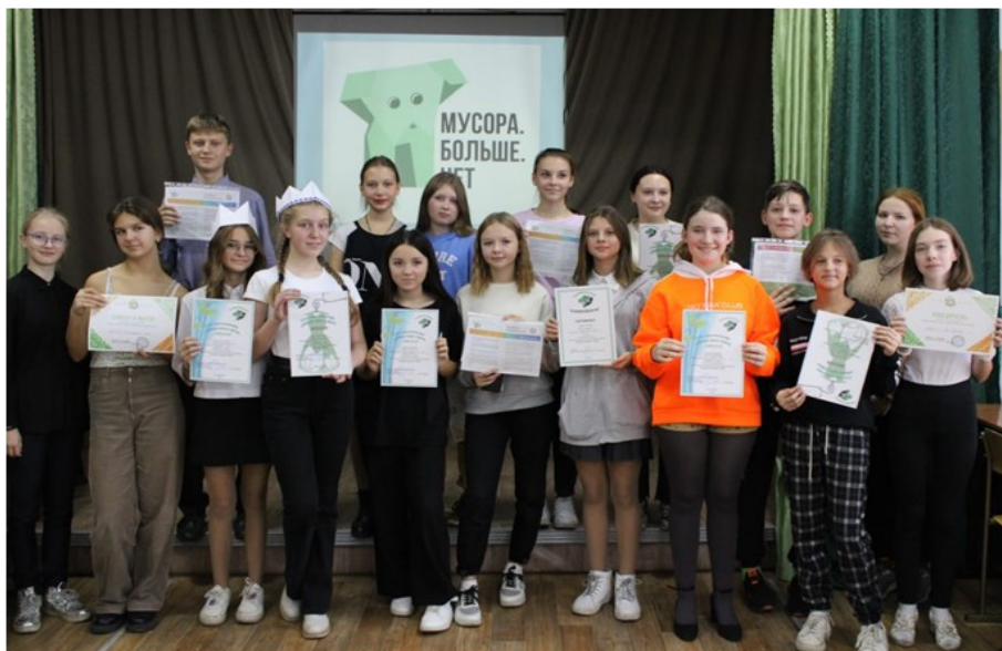
Участники экологического слета «Мусора. Больше. Нет»

Сначала ребята участвовали в викторине из 14 вопросов, потом было экологическое дефиле—демонстрация нарядов из потенциального мусора. Все команды подготовились достойно. Все костюмы были очень оригинальными! Нас поразило наряд из ложек, в него было вложено много труда и кропотливой работы. Были разыграны целые сценки в этих костюмах. Победила команда ДЮЦ— «НЭО».